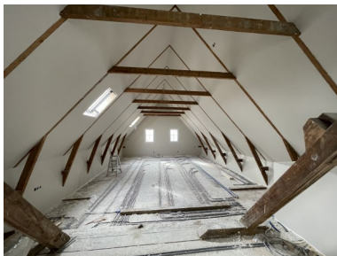
Auditorium in afrondende fase